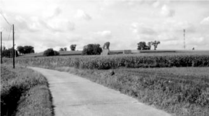
Zicht op de Ruidenberg met de mast.