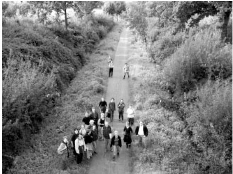
De sleuf van De Groene 62 ter hoogte van Wijnendale dorp.

Van Torhout naar Oostende heb je een prachtig zicht op het ver-